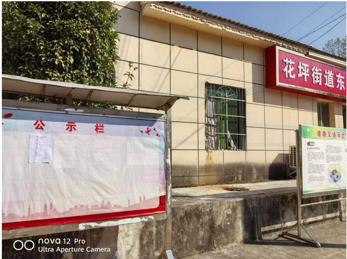
图 2.2-1 公众参与信息第一次现场张贴公示照片