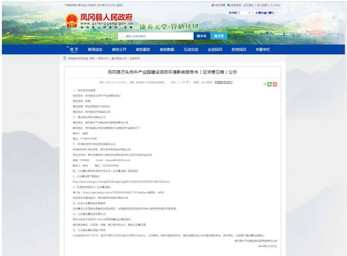
图 3.2-2 公众参与信息第二次网上公示截图