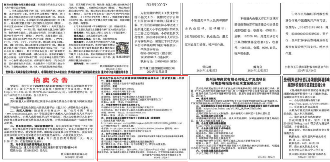
图 3.2-3 公众参与信息第二次报纸公示照片（一）