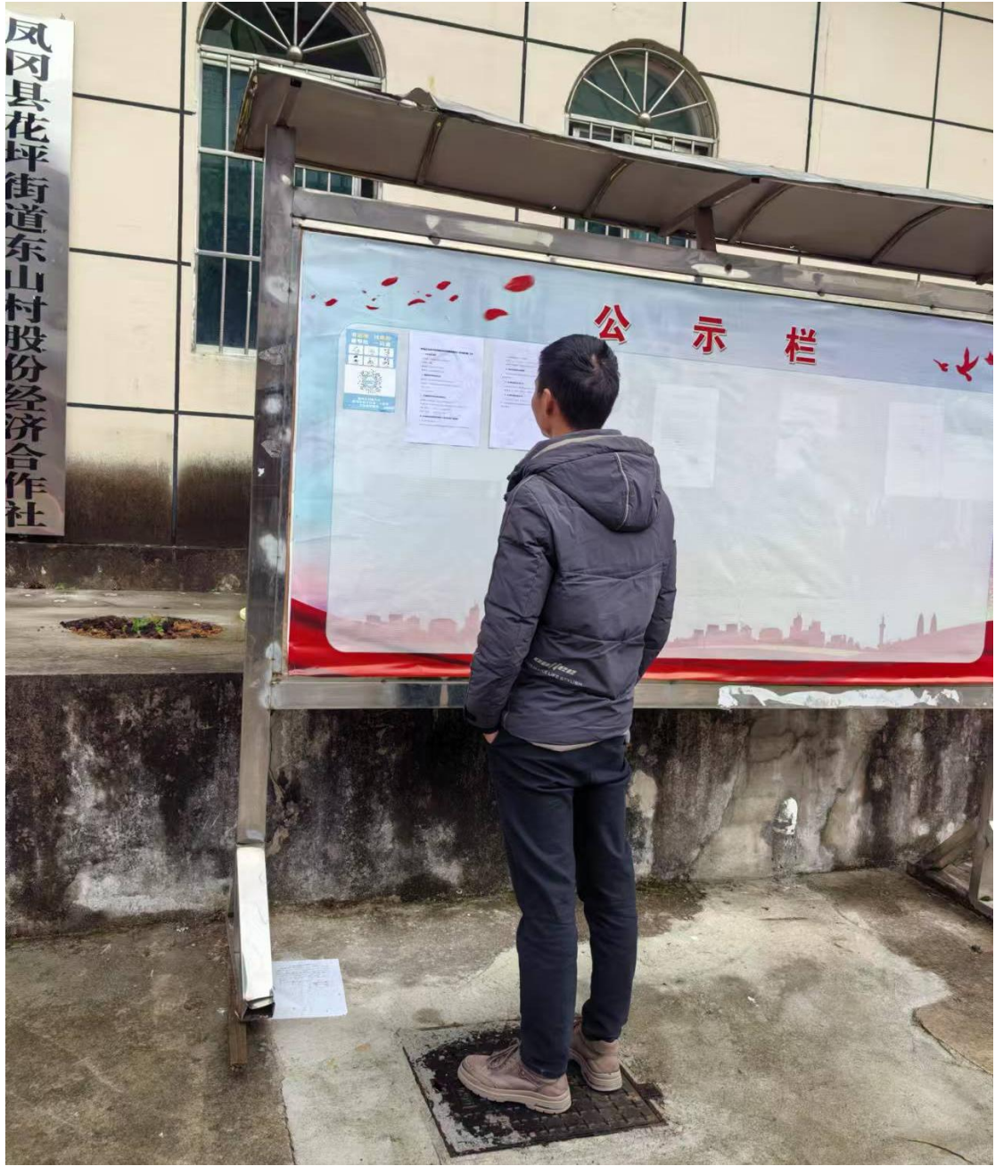
图 3.2-1 公众参与信息第二次现场张贴公示照片